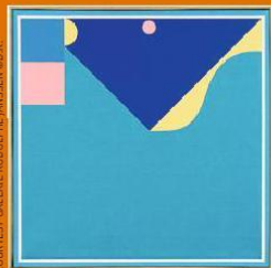
Léon Wuidar, "29 juillet 1989", huile sur toile, 60 x 60 cm, 1989.

Double bruxellois pour l'artiste liégeois Léon Wuidar pp.2-3