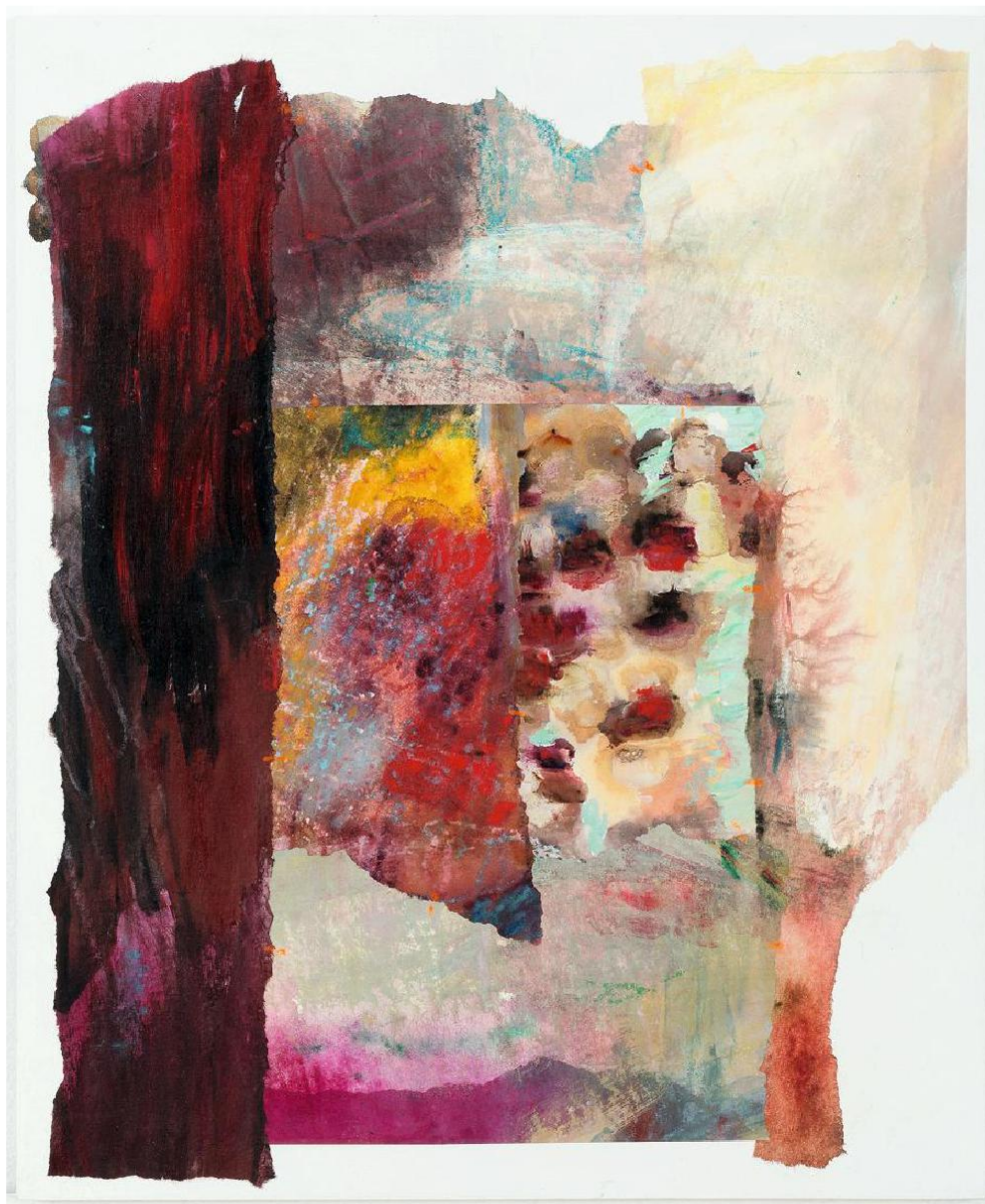
NOËLLE KONING, SANS TITRE, 44CMX36CM, 2014, PHOTO VINCENT EVERARTS © NOËLLEKONING.JPG